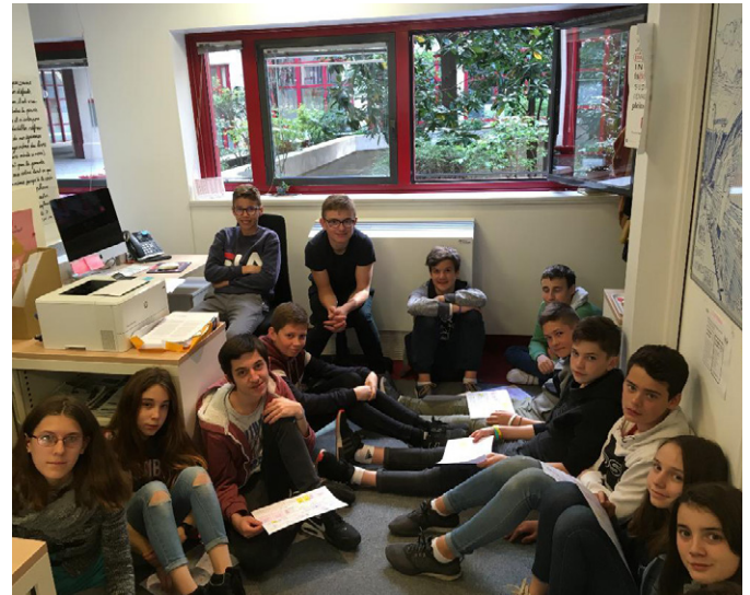
Les 4 es de Louis-Merle à la rédaction le 11 avril.

Le 11 avril 2019, des 4 es du collège Louis-Merle de Secondigny (1800 habitants) dans les Deux-Sèvres sont venus nous rendre visite dans le cadre de leur séjour à Paris. Impressionnée par le dynamisme de ce collège, la rédaction s'est lancé un défi : et si nous allions les voir à notre tour ?