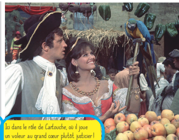
Ici dans le rôle de Cartouche, où il joue un voleur au grand cœur plutôt justicier !