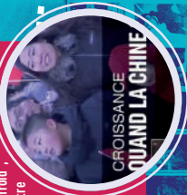
CROISSANCE QUAND LA CHINE

Le sujet sur le ralentissement de la croissance en Chine arrive en 9 e position dans le JT. Il est placé en fin de journal, car c'est un sujet dit "froid", qui aurait pu passer un autre jour. Pendant deux minutes, Arnault Miquet donne la parole à des commerçants chinois dont l'activité est en baisse et interviewe des économistes inquiets.